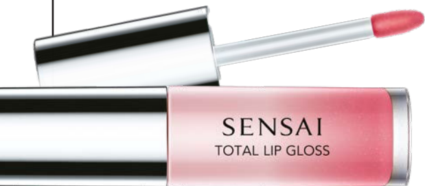
SENSAI TOTAL LIP GLOSS

Persönliche Produktempfehlungen aus der Redaktion.