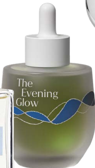
The Evening Glow