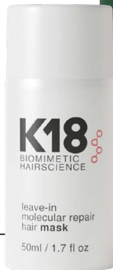
K18 BIOMIMETIC HAIRSCIENCE