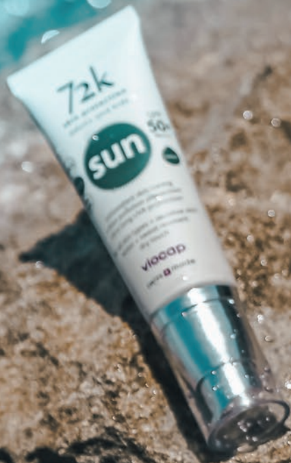
72k sun SPF 50+