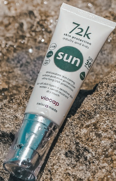
72k sun SPF 30 tinted