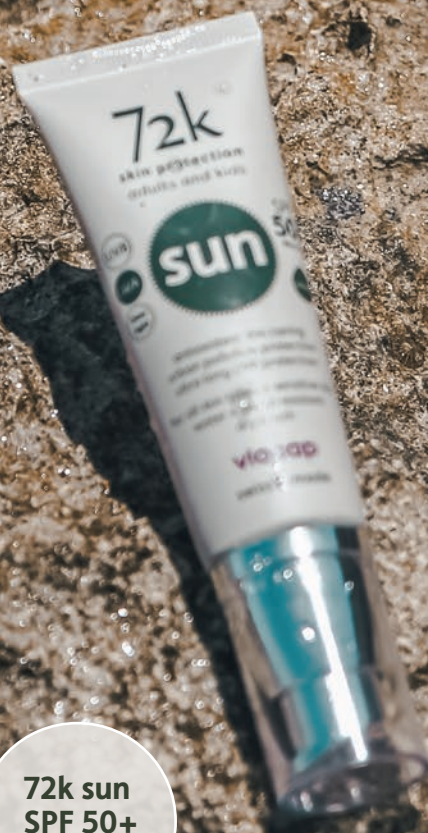
72k sun SPF 50+ tinted